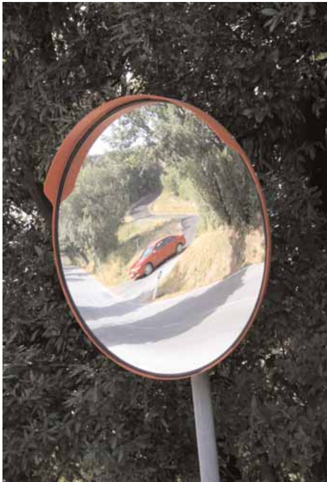
Даже неподалеку от столицы есть удивительные места

Куда сбежать из Москвы, пока хорошая погода